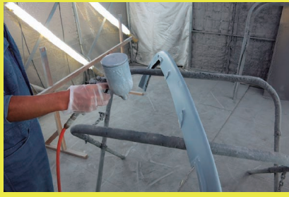
オールベンするためには40万円以上の高額な費用が必要に。失敗しないためにも、板金屋サンの綿密な話し合いは必須だ。

質問の答えになっていないかもしれませんが、一番良いのは試し吹きをすることだと思います。頭