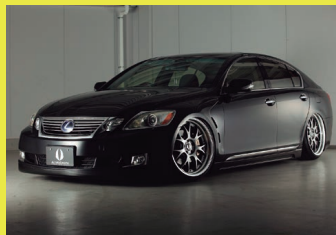
エイムゲインのデモカー。エアロは純VIP。ホイールは20インチのGII Mで、F9J+23・R10J+23。