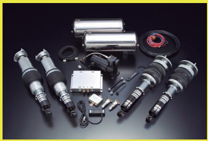
こちらはボルドワールドのアルティマ アドバンス ネクスト。ダンパーは全長調整式で、減衰力32段階調整機構も装備されている。