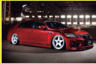
純VIP GTエアロを装着した19GS。ホイールは20インチのGVSで、F9.5J+33・R10.5J+38を合わせた。